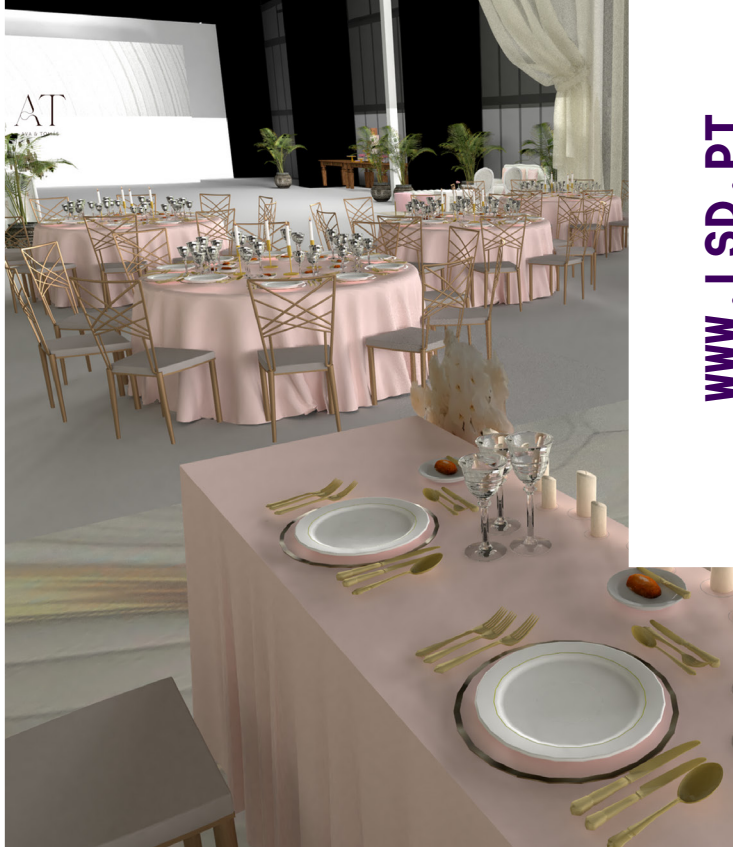
Projeto de aluno do curso de Design de Eventos da LSD.

Os fornecedores; Como encontrar recursos de design e estabelecer parcerias de fornecedores; Negociação de preços e calendarização de pagamentos; Os seguros a efetuar; O cálculo de honorários.