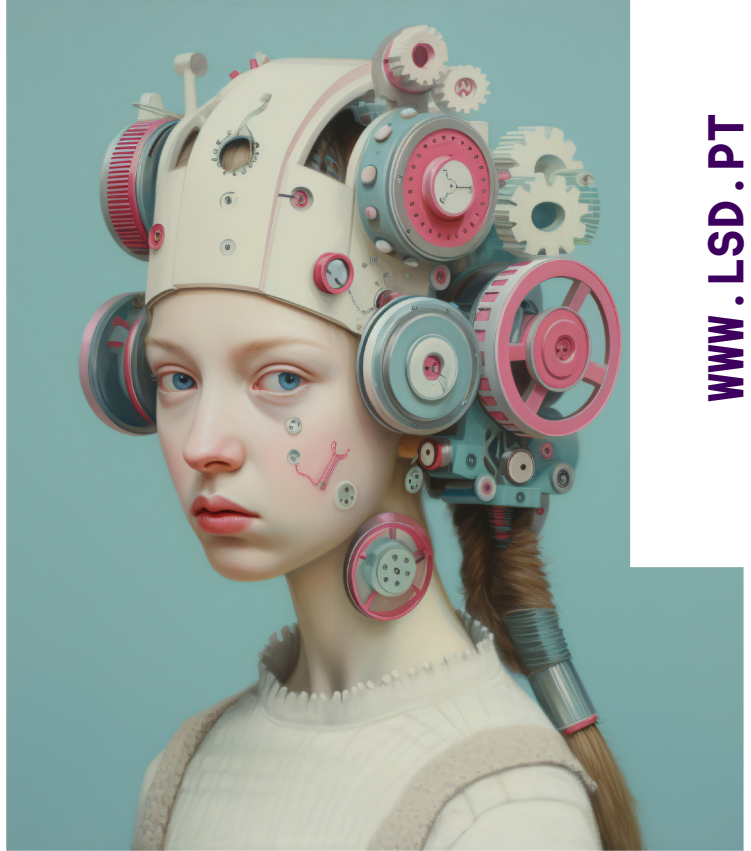
Imagem criada com recurso a IA.

Desenvolvimento de projeto criativo com IA; Aplicação em contexto real (branding, conteúdo, etc.); Construção de narrativa; Apresentação e reflexão crítica.